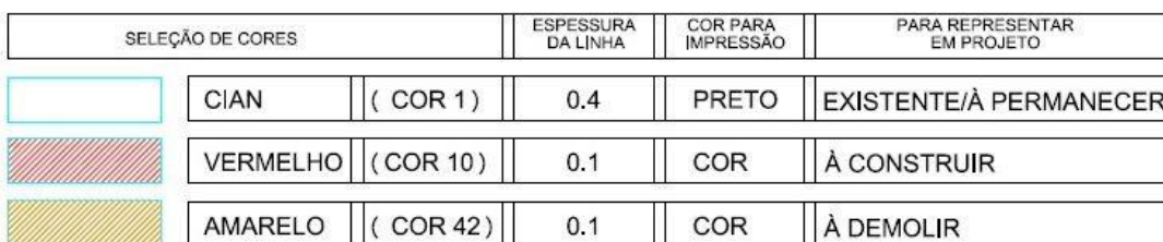
TABELA DE LAYER