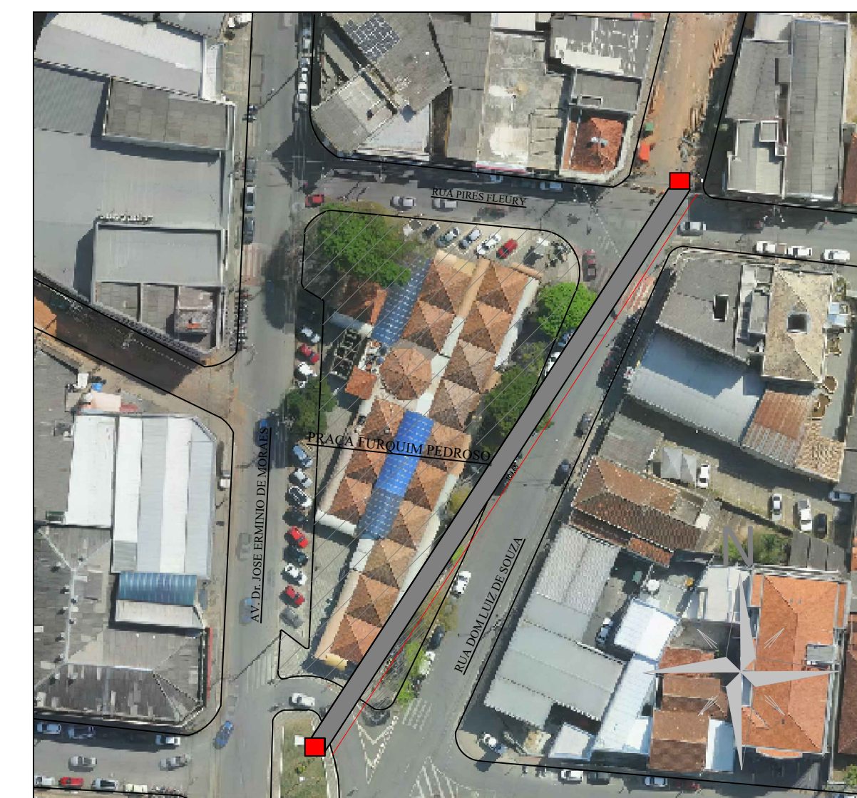
IMPLANTAÇÃO E LOCALIZAÇÃO 5/E