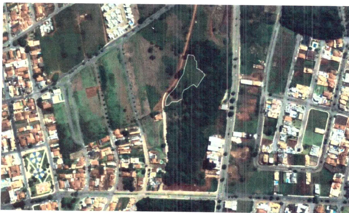
Figura 1 – Mata do Carmo trecho situado no bairro Jardim Dona Míriam, com destaque da área de 5.200 m 2 a ser plantada conforme Ação 01 deste Termo de Compromisso.

AÇÃO 01 – Execução de Termo de Recuperação Ambiental – TCRA – cuja intervenção deverá ser realizada na Avenida Europa, na Mata do Carmo, no trecho situado no Bairro Jardim Dona Míriam, com área de 5.200 m 2 (cinco mil e duzentos metros quadrados), conforme figura 1 abaixo: