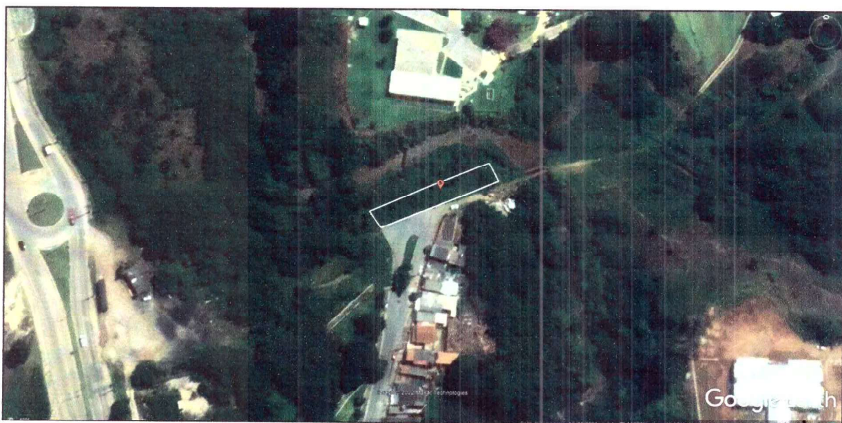
Figura 4 – Roçada – Área localizada na Vila Bom Jesus – Área 5 – Total da área: 523,00 m 2