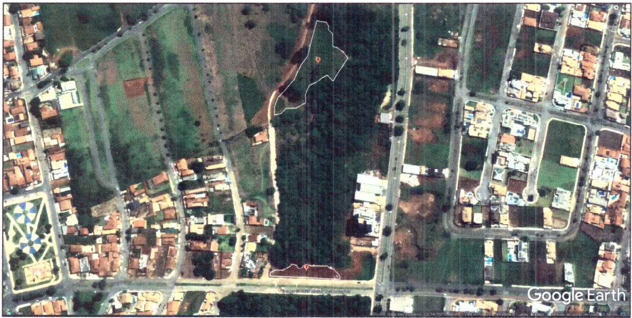
Figura 5 – Roçada – Áreas localizadas na Avenida Europa – Área 6 e 7 – Soma total das áreas: 6.559,00 m 2