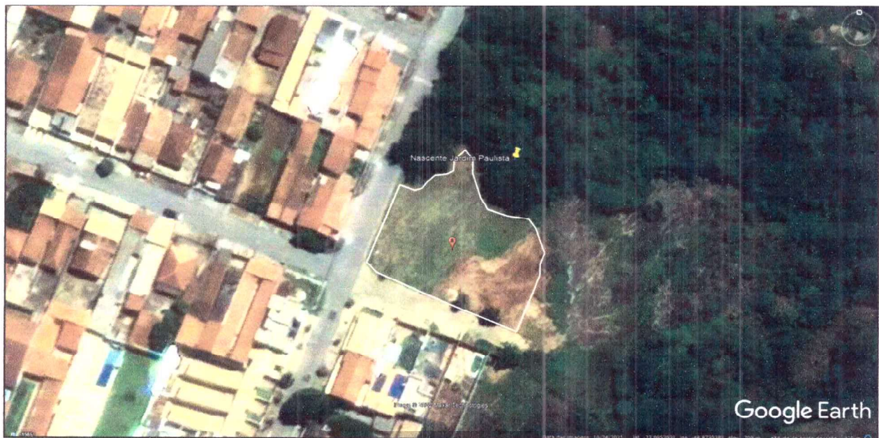
Figura 6 – Roçada – Área localizado no Jardim Paulista – Área 8 – Total da área: 1.266,00 m 2

[Handwritten signatures and marks in blue ink]