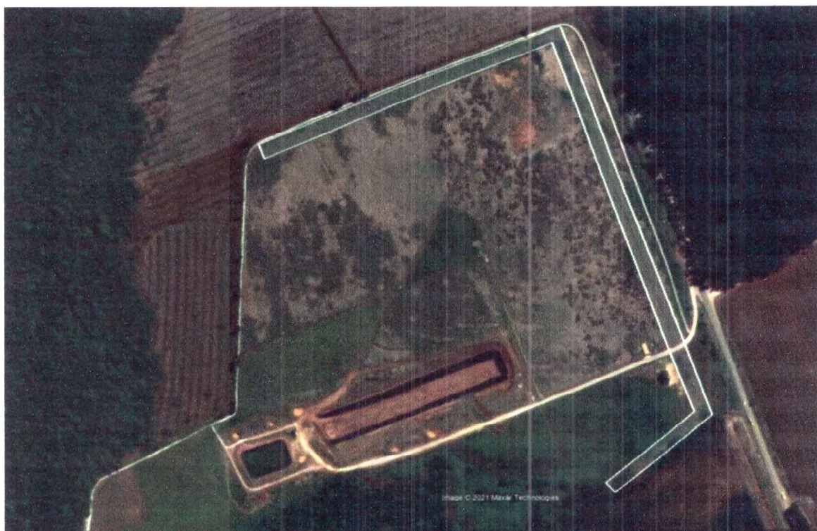
Figura 2 – Imagem aérea do Aterro Sanitário com destaque da área do cinturão verde de eucalipto, onde será realizada a manutenção conforme Ação 02 deste Termo de Compromisso