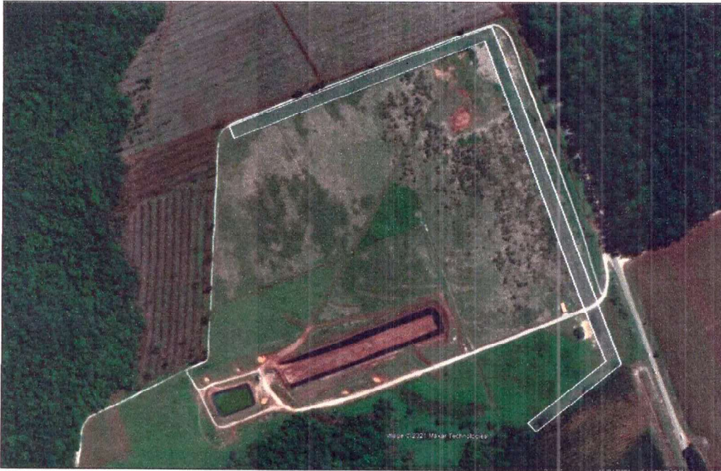
Figura 2: Imagem aérea do aterro com indicação da área do cinturão verde de Eucalipto.