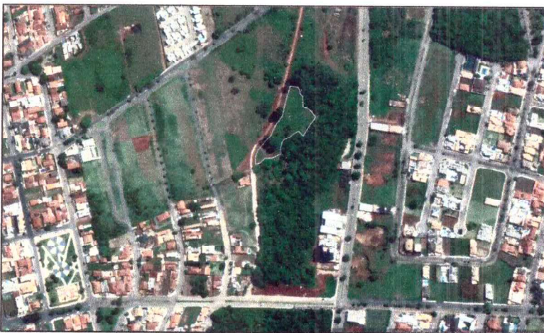
Figura 1: Área a ser plantada 5.300m 2

Mata do Carmo do trecho situado no bairro Jardim Dona Míriam.