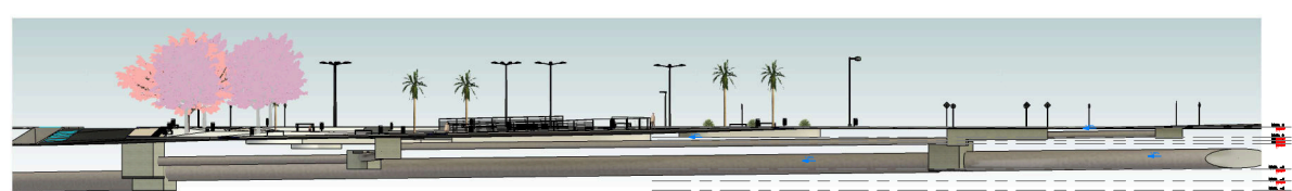
⑤ CORTE AA 1:200