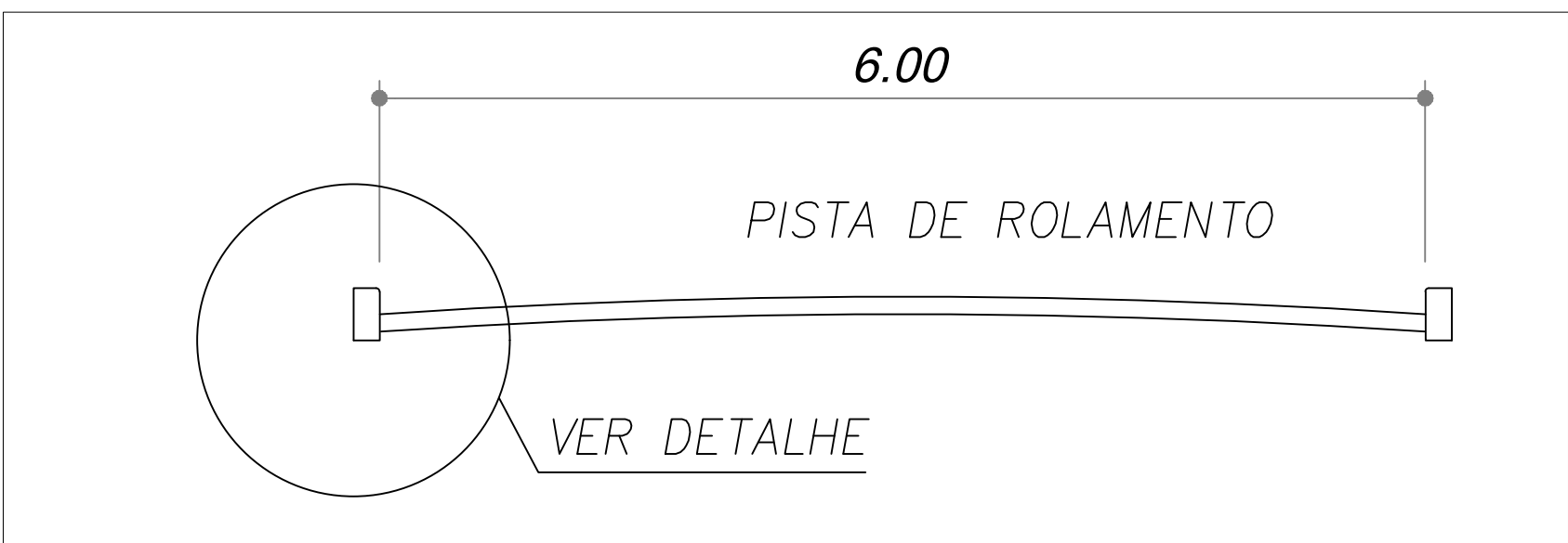
DET. PERFIL ESTRADA MUNICIPAL ITAPEVA S/ESC.